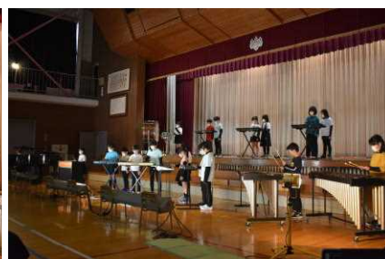
3年生 合唱・合奏「夢色コンサート」