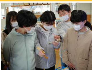
野鳥教室・観察会(6年生)