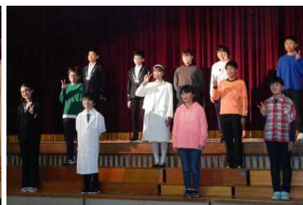
6年生 劇「エルコスの祈り」