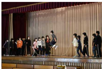
4年生 運動表現「ジャンプ!ジャンプ!ジャンプ!」