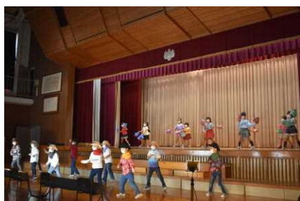
1年生 ダンス「げんきにダンス」

本年度より、授業時数確保のため、行事のための特別な準備や指導をするのではなく、日頃の学習成果を発表する場として「学芸会」を「学習発表会」として実施しましたが、いかがだったでしょうか。本日配付しました保護者アンケートにてご意見をお寄せいただければ幸いです。