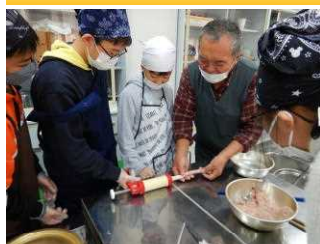
ソーセージ作り体験(5・6年生)