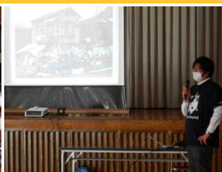
おおさきエコアクション(4～6年生)