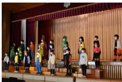
2年生 群読「ぼくとわたしと友達と」