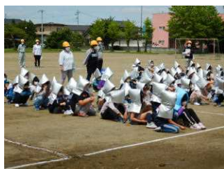
6/14 避難訓練・引渡し訓練