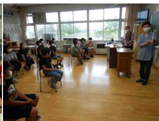
6/24 読み聞かせ会(2・4・6年生)