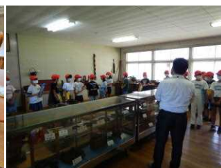
6/20 郷土資料室見学(4年生)