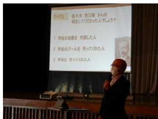
6/21 講話朝会(校長先生)