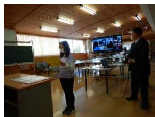
始業式 (4/8・リモート開催)