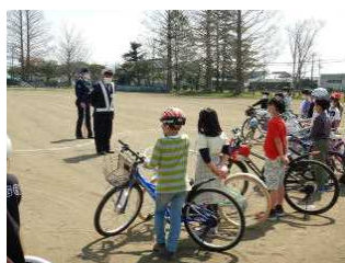
交通安全教室 (4/12・左：4年生、右：1年生)