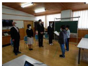
披露式 (4/8・リモート開催)