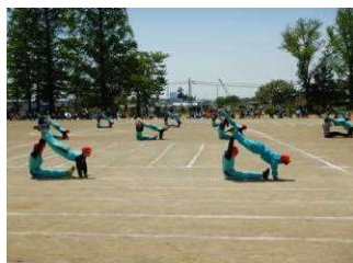
団体種目「Water boys and girls」（5・6年生）