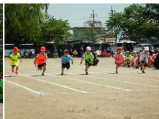
全校たてわりリレー