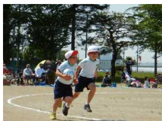
団体種目「野をこえ 山をこえ 力を合わせて♪」（3・4年生）