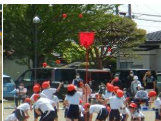
団体種目「玉入れ」（1・2年生）