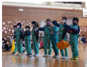
1年生を迎える会(4月22日)

校長先生と挨拶をしている様子です。手前の6年生、その奥の4年生のびんと伸びた背筋にご注目ください。