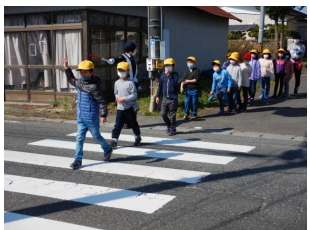
交通安全教室(4月12日)

1年生の給食が始まっています。新型コロナの感染防止のため、当時は前を向いて「黙食」になります…。