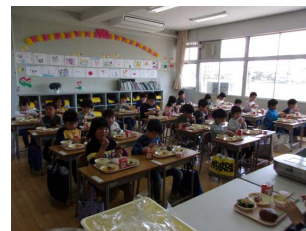
1年生の初給食(4月15日)

各学年からの学校紹介や、〇×クイズなどで楽しい一時を過ごしました。(写真は5年生の学芸会紹介です。)