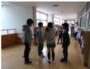
たてわり活動(4月14日) / クラブ活動(4月21日)

異年齢集団での活動を通して、他者と協働的に学ぶ力や、リーダーとしての素地を身に付けさせたいと考えています。5・6年生は、下級生に優しく声を掛けながら集団をまとめ、先頭に立って頑張っており、大変立派です。