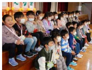
1年生を迎える会 4/26 防犯パトロール隊対面式4/28