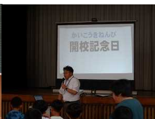
開校記念講話朝会