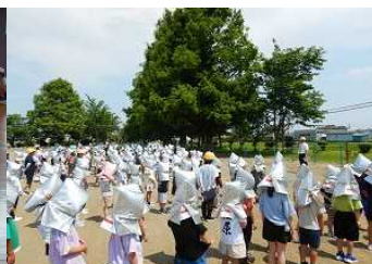
避難訓練・引渡訓練