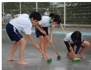
プール清掃(5・6年生)

今週からは、いよいよ7月。そして、夏休み前の学習もあと3週間ほどです。これからの3週間、勉強も学校生活も、4月に立てた目標に一步でも近付けるよう、指導・支援していきたいと思います。ご家庭でもご協力をお願いいたします。