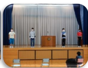
・ 5, 6年生の発表