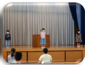
・ 1, 2年生の発表