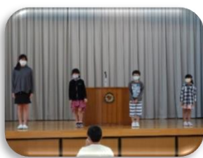
・ 3, 4年生の発表