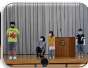
・ コスモス学級の発表