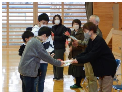
（お礼の手紙の贈呈）

1年生は田尻給食センターの栄養士さん、2年生は調理員さん、3、4年生は配送員さん、5、6年生は食材を提供していただいている田尻ハムの職員の方にそれぞれ手渡しました。給食のありがたさを感じ、毎日おいしい給食をいただきたいと思います。