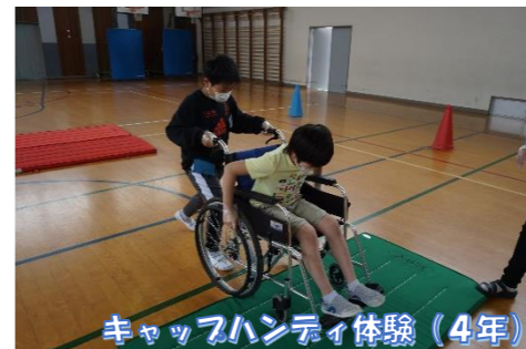
キャップハンディ体験(4年)