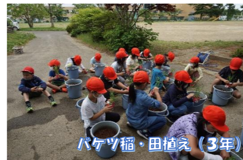
バケツ稲・田植え(3年)