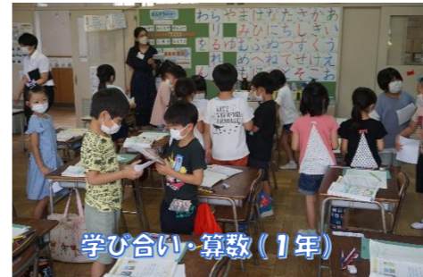
学び合い・算数(1年)

◎ 元気なあいさつと丁寧な言葉遣い、靴をそろえることができる児童の割合が85%以上を目指します。