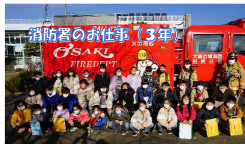
消防署のお仕事(3年)