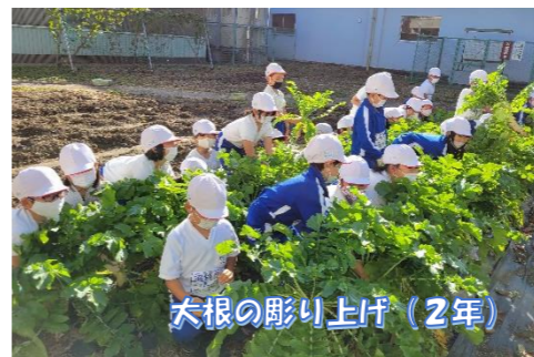
大根の彫り上げ(2年)