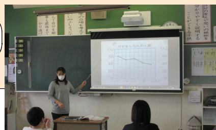
6年生算数の授業の様子

2月5日には縄跳び記録会が行われました。例年、保護者の皆さんをお招きしての記録会を行っていましたが、今年は子供たちだけの開催となりました。また、競技中の間隔を確保するために、1・3・6年と2・4・5年の2回に分けての実施、長縄は行わず、個人種目に限るなどの対策を講じました。