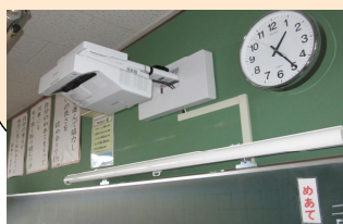
今回設置された プロジェクターと スクリーン

今後は、子供たち一人一人がiPadをもつことになり、授業のスタイルもどんどん変わっていくと考えられます。私たち教員も効果的な活用を目指して研修を進めていくと同時に、積極的に使っていくことでスキルと意識を高めて参ります。