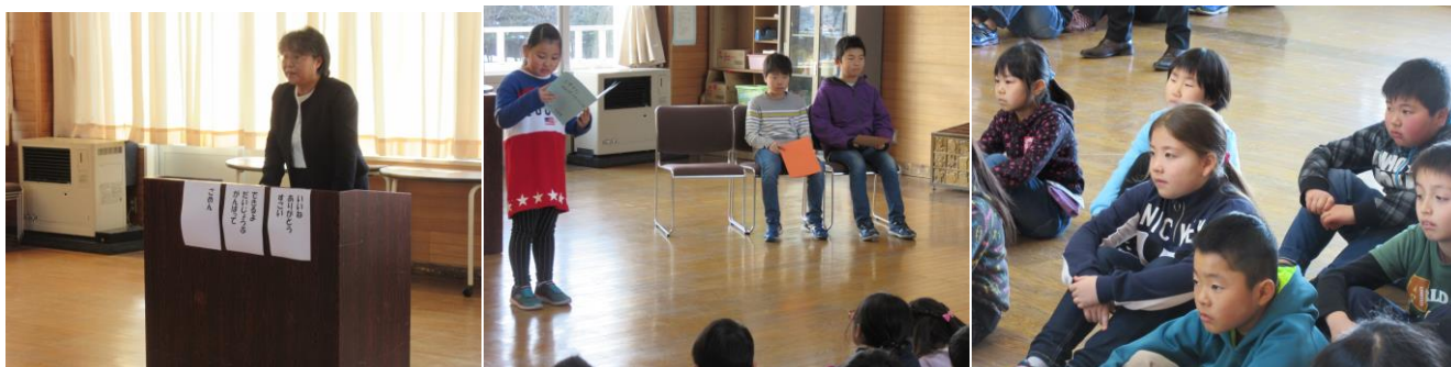
始業式の様子から（写真は、左から順に校長講話・児童代表のことば・真剣な態度で話を聞く様子）