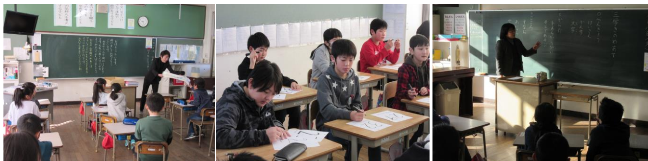
各学年の教室では、早速3学期の取組がスタート（写真は、左から順に3年生・6年生・1年生）