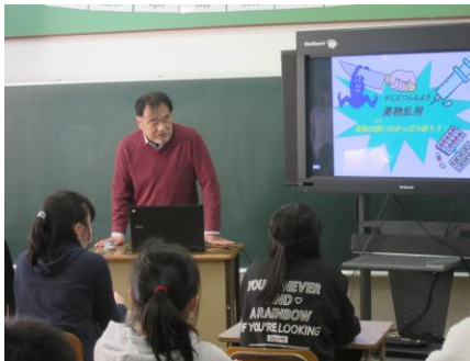
1月21日 6年薬物乱用防止教室

＜学校点描＞ ※ お話朝会は「脳の話」でした（詳細は2月17日発行の保健だよりをご参照ください。）