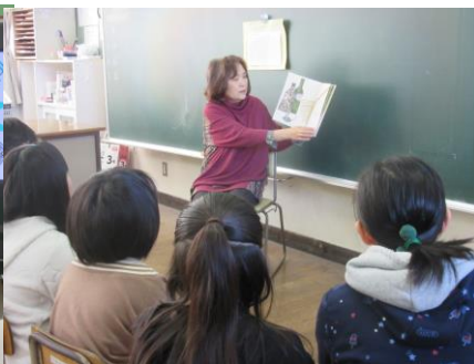
1月27日 読み聞かせ（さやかハーモニー）