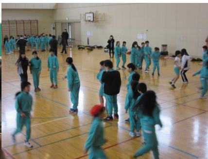
2月5日 縄跳び記録会