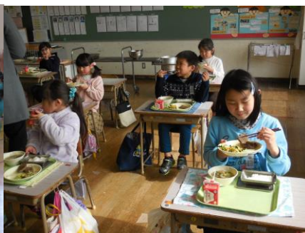
2月14日 ステーキ給食