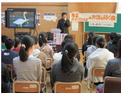
1月31日放課後学び支援（4～6年）