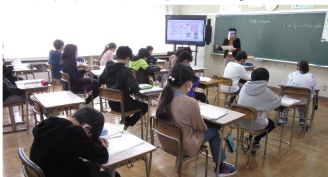
（6年生外国語：”Let’s think our food”の様子）