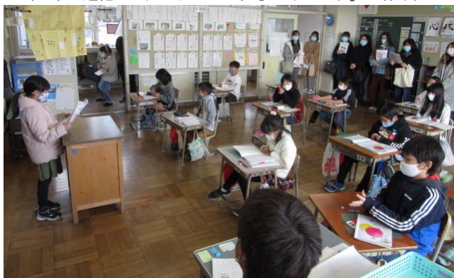
（3年生国語：「ことばあつめ」の様子）