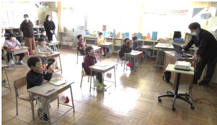
（2年生算数：「1000より大きい数を調べよう」の様子）