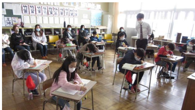
（4年生国語：「熟語の意味を考える」の様子）