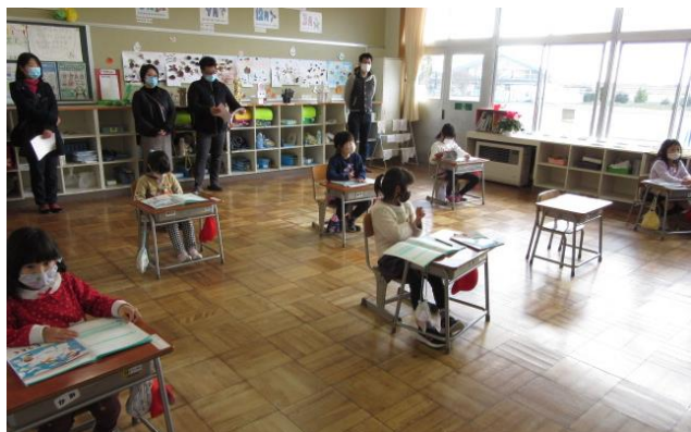
（1年生道徳：「みんながつかうものやばしょ」の様子）

今年度2回目の授業参観には、多くの保護者の皆様に御参加いただきました。誠にありがとうございました。1学期の参観日より一回りも二回りも成長してたくましくなった子供たちの様子をご覧いただけたことと思います。また、その後の学級懇談会では、各担任と子供たちの様子やこれからの行事予定などについて有意義な話し合いができたことと思います。頂戴した御意見や御要望は今後の指導や学校運営に生かしてまいりたいと思います。2学期後半も引き続き御支援・御協力のほどよろしくお願いいたします。