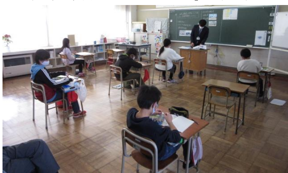
（5年生社会：「工業生産を支える輸送と貿易」の様子）