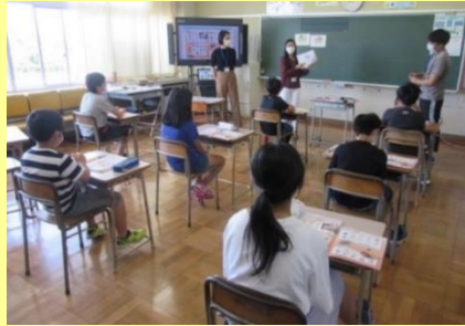
（5年生の外国語の授業の様子）