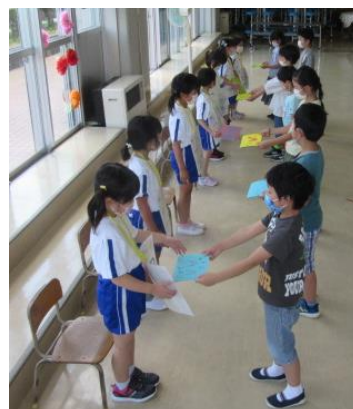
(右: 2年生からのプレゼントを受け取る様子)

* 今年度の資源回収は、九月五日(土)に実施予定です。どうぞよろしくお願いいたします。