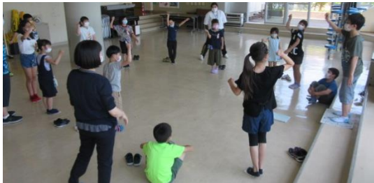
（わかばホールで活動するC班の様子）

10日（水）3校時、今年度1回目の縦割り班活動を行いました。全校児童を15人前後の4つの班に分け、6年生が考えたゲーム等をして楽しく交流活動しました。学校には、子供たちの歓声が響き渡り、久しぶりの縦割り遊びを楽しんでいました。年間合計6回程度実施する予定ですので、違う学年の子供たちが交流する楽しい活動にしたいと思います。