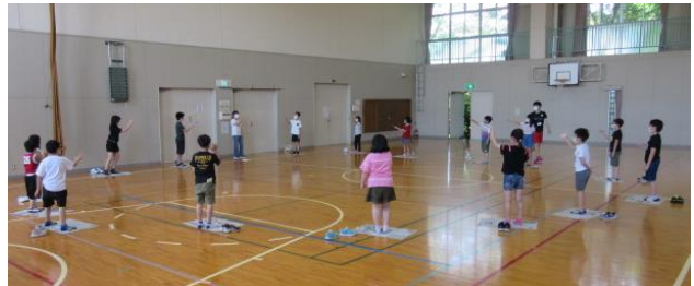
（体育館で活動するA班の様子）