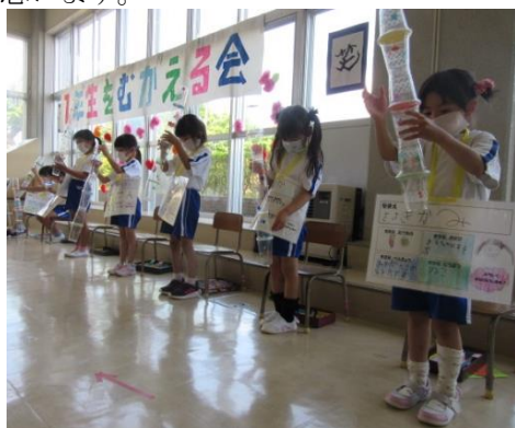
(5年生からのプレゼントで遊ぶ様子)