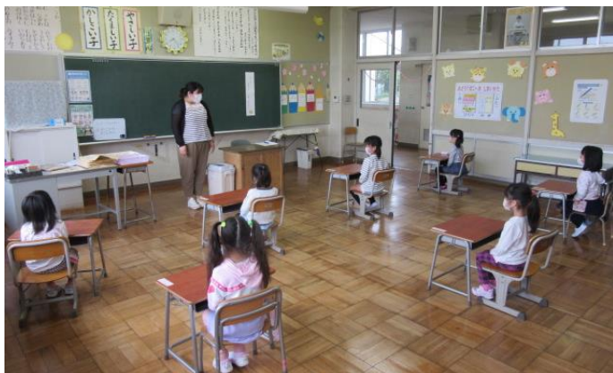
（1年生の登校日の様子）

来週は、3つの学年ごとに3校時限の登校日となります。保護者の皆様方にもますます御協力をいただくこととなりますが、どうぞよろしくお願い申し上げます。