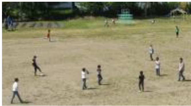
（休憩時間に校庭で遊んでいる様子）