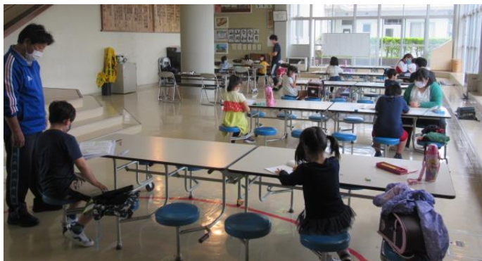
（1階ホールでの学習会の様子）

5月13日（水）～15日の3日間、希望者を対象とした自主学習会を開催いたしました。連日約30人の参加があり4月よりも増え、のべ89人の参加となりました。登校後の、健康観察や手洗いなどの流れもスムーズになり、開始の合図前に学習に取り組む積極的な姿が見られました。天気にも恵まれ、暖かい陽気のもと、休憩時間には校庭で元気に遊ぶ姿も見られました。チャイムも鳴らし、時間の区切りをはっきりするようにしたところ、黙々と勉強に取り組む姿、友達と仲良く遊ぶ姿とメリハリのある過ごし方ができていました。学校の再開に向けてペースを取り戻しつつある姿に、明るい見通しが持てた3日間となりました。