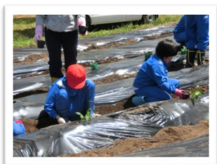
↑【きらきら農園での作業】