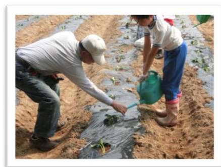
↑【さつまいも畑での作業】