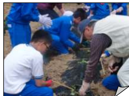
さつまいも畑での作業