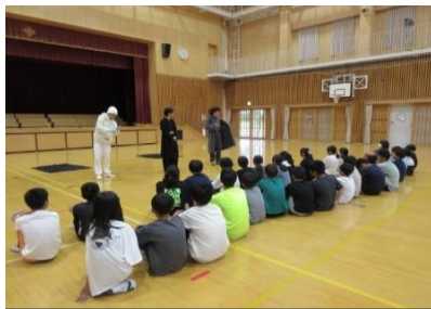
『芸術鑑賞会』7/11 に5・6年生が「仙台シアターラボ」の皆さんのお芝居を鑑賞しました。その後に二人一組で「まねっこ遊び」をして楽しみました。