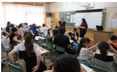
4年生 外国語活動 「4月からの学習を振り返ろう」