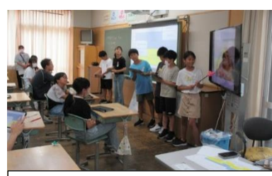
6年生 総合学習 「修学旅行の自主研修のコースを発表しよう」