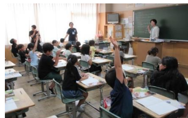
3年生 理科 「風やゴムのはたらき」