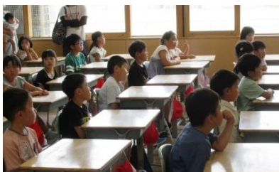
1年生 算数 「わかりやすくせりしよう」

7月9日(水)に実施した学習参観には、お忙しい中たくさんの方の保護者の方においでいただき、ありがとうございました。子供たちの様子はいかがでしたでしょうか。どの教室でも、子供たちは日頃の学習の成果をおうちの方に見てもらおうと頑張っている姿が見られました。その後の学年・学級懇談会にもご参加いただきありがとうございました。7月23日(水)から始まる二者面談もどうぞよろしく願いいたします。