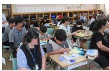
5年生 家庭科 「ソーイング はじめの一步」