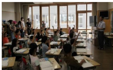
2年生 算数 「3けたの数」