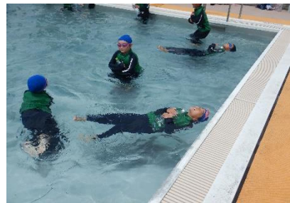
『着衣水泳』7/16 に高学年・中学年、7/17 に低学年がプールで着衣水泳を行いました。ペットボトルを抱きかかえて浮く練習などを行いました。