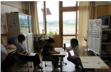
ひまわり 国語 3年「心が動いたことを詩で表そう」 6年「心の動きを俳句で表そう」