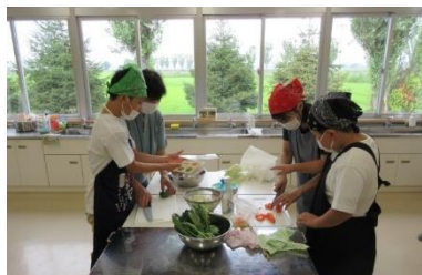
コスモス 生活単元 「野菜をおいしく食べよう」

＜夏休み中の緊急連絡について＞ 事故にあったり、病気やけがで入院したりした時は、学校に連絡をください。 ★平日の日中 松山小学校 電話 55-3129 ★平日夜間、休日、学校閉庁（8/8～8/17）の緊急の場合は、teturu 連絡欠席（種別を欠席にして）お知らせください。 それ以外は、休み明けに学校へご連絡願います。