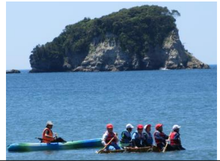
協力して作ったいかだで海に出ました

6月17日(火)～6月18日(水)の1泊2日で5年生の子供たちが松島自然の家に合宿に行ってきました。計画を立てるところから下伊場野小学校の5年生の児童たちと一緒に活動し、いかだづくり、ウォークラリー、キャンプファイヤー、野外炊飯などを行い、更に絆を深めてきました。協力しながら全ての活動に取り組みました。5年生の成長を実感した2日間でした。