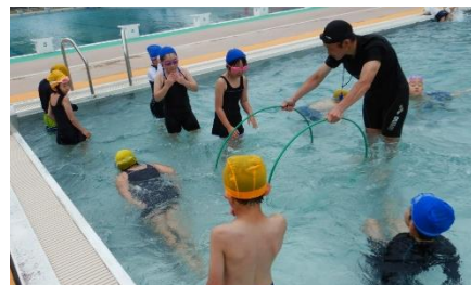
低学年の輪くぐりの様子です

6月12日(木)にプール開きを行い、体育での水泳学習を開始しました。晴れて気温の高い日は、多くの児童が水泳学習を楽しみにしています。「今日はプール入れますか?」「プールに入りたい!」と担任に話している子供たち声が聞こえてきます。水着等の準備や洗濯、毎日のプールカードの押印等のご協力ありがとうございます。