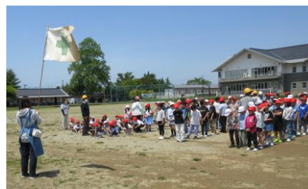
地震避難訓練で校庭に避難しました

6月2日(月)に地震避難訓練と幼小中引渡し訓練を行いました。避難訓練では、子供たちは緊張感をもって素早く行動することができました。引渡し訓練は、様々な緊急時を想定して車での引渡しの訓練を初めて行いました。保護者の皆様のご協力で、安全な引渡しについて確認を行うことができました。合わせてアンケートのご協力もありがとうございました。今後は反省点や課題点をもとに実行性のあるものに改善していきます。