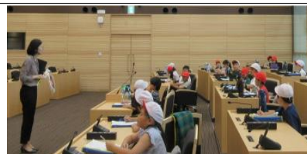
市議会の議場で説明を聞きました

6月10(火)にデリシャスファーム見学(鹿島台)、6月23(月)に大崎市役所見学、6月24(火)にキャップハンディ体験を行いました。キャップハンディー体験は、社会福祉協議会の皆さんの協力をいただきました。校外学習や体験活動を通して、分かったことや感じたことなどの感想をまとめました。