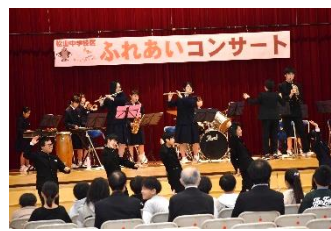
松山中学校吹奏楽部

松山小は学習発表会で発表した3曲、下伊場野小は教職員も参加して合唱2曲、松山中3年生は合唱1曲、吹奏楽部は2曲、吹奏楽部の演奏で3年生が校歌を披露しました。コンサートが終わった後、松山小6年生からの依頼で松山中に合唱と演奏、ダンスを披露していただきました。それぞれの学校のよさが表れた発表であり、幼稚園児から中学生まで一緒に楽しめた時間となりました。