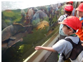
1, 2 年生「仙台うみの杜水族館」