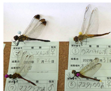
「理科：赤トンボの標本」