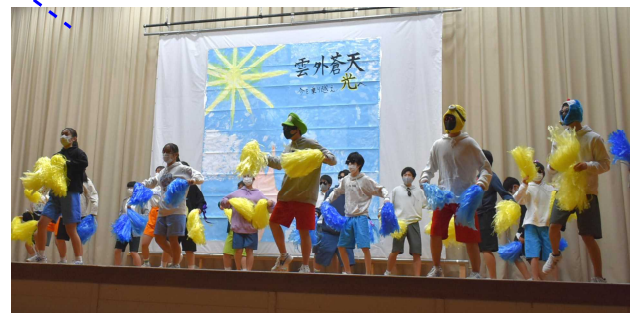
※ステージの背景が全校制作です