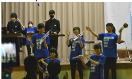
※3年生部員にとって最後の演奏となりました