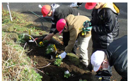
全校 花いっぱい活動