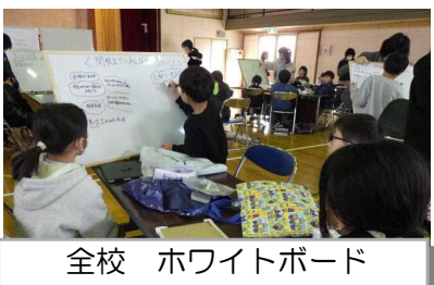
全校 ホワイトボード ミーティング®