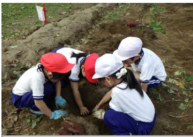
1・2年 さつまいも収穫