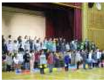
2年「みんなにありがとう」