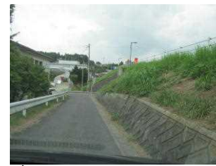
9 (2) 跨線橋脇