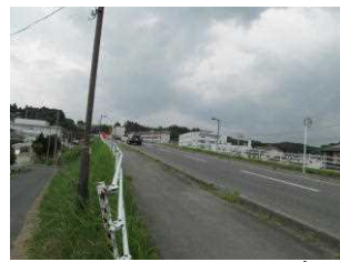
9 (1) 跨線橋