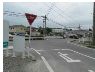
8-9 (2) 道路幅狭い