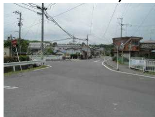
8-9 (1) 交差点