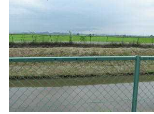
1 2 用水路