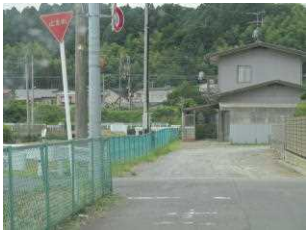
1 (1) 増水時冠水しやすい