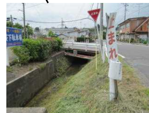
8-9 (3) 用水路