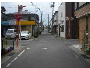
4 (3) 交通量多く 右折左折車が多い