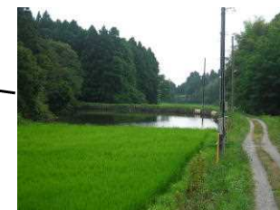
4 (4) ため池