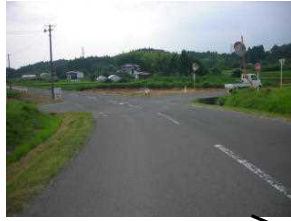
2 交通量多い スピードを出す