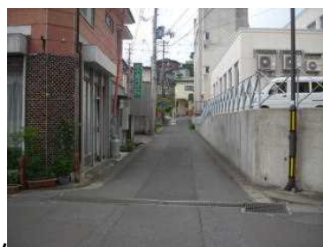
2 道路の見通しが悪い