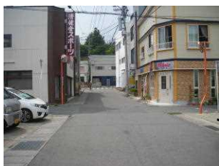
4 (2) 街灯が少ない