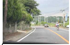
霊園上がり口国道