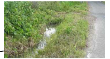
7 増水時冠水しやすい