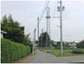
上戸公園より上の道