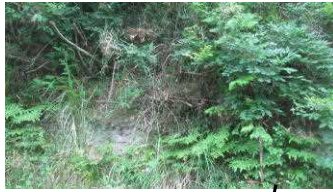
道路の見通しが悪い 崖崩れの危険