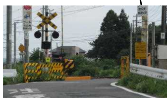
信号機のない横断歩道