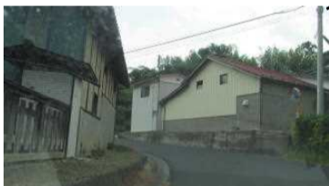
6 道路の見通しが悪い