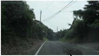
人通りが少ない 街灯が少ない 見通しが悪い道