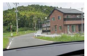
御屋敷弁当裏通り