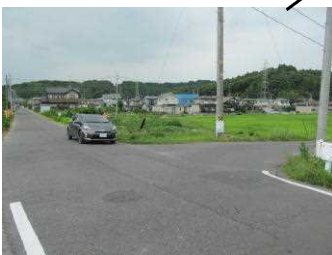
交通量が多い 道路の見通しが悪い