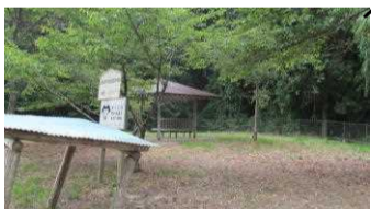
11 茂みのため人目につきにくい公園