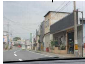
鹿島台タクシー倉庫