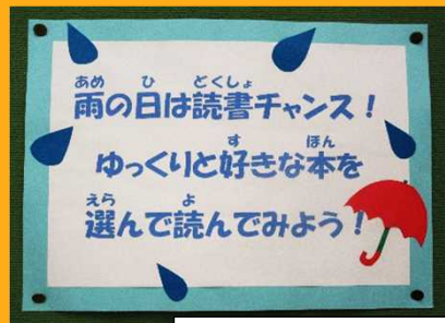
読書の楽しさを呼び掛ける図書館前の掲示