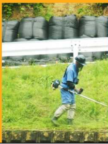
斜面の草刈りをする業務員さん達