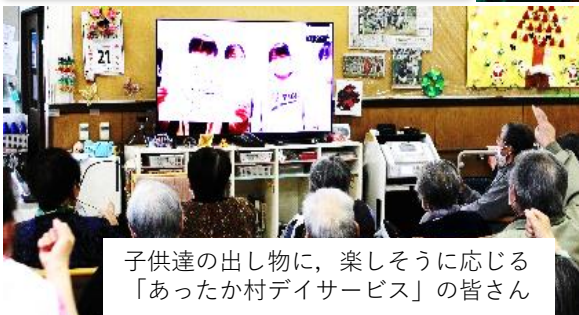
子供達の出し物に、楽しそうに応じる「あったか村デイサービス」の皆さん

11月30日(木)、車椅子と白杖を使用したキャップハンディ体験学習を行いました。思いやりをもって接することの大切さを実感しました。12月20日(火)福祉講話をしていただき、「福祉＝思いやり」であることを教えていただきました。それらの学びを受けて、子供たちが高齢者の皆さんへの思いやりをもった内容で、オンライン交流をしました。