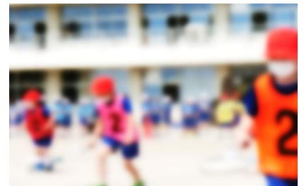
3年生「勝負のゆくえは運しだい」