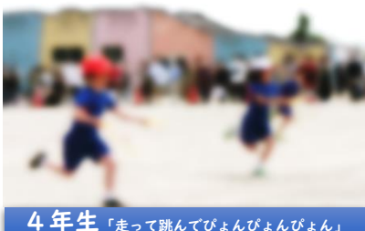
4年生「走って跳んでびんびんびん」