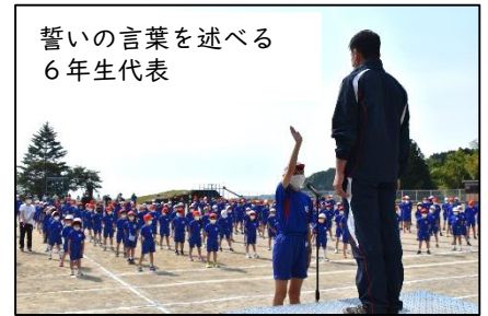
誓いの言葉を述べる 6年生代表

5月21日（土）、岩出山小体育会を、無事開催することができました。今年度も、新型コロナウイルス感染対策のため、限定参観や、学年部別での競技・演技の実施となりましたが、さわやかな風が心地よい晴天の下で、子どもたちが精一杯取り組むことができたことは、私たち教職員にとって何よりうれしいことです。保護者の皆様には、たくさんの御協力をいただき心より感謝申し上げます。