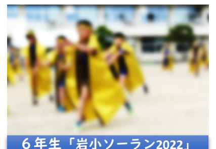
6年生「岩小ソーラン2022」