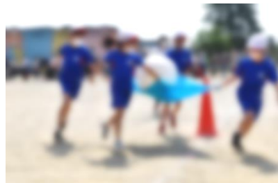
2年生「まぼうのじゅうたん」