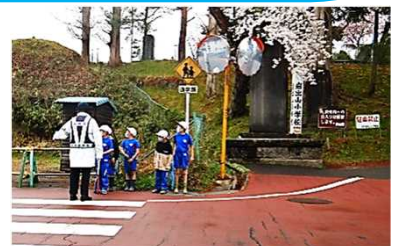
指導隊の方に見守られて （2年生）

また、19日（火）から21日（木）の3日間は、低・中・高学年の順に、スクールバスの安全な乗り方について学習しました。校庭に乗り入れたスクールバスを使って、体験を通して学習しました。