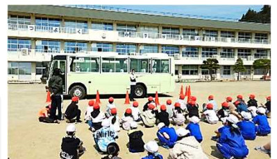
スクールバス乗車の学習 （3年生）