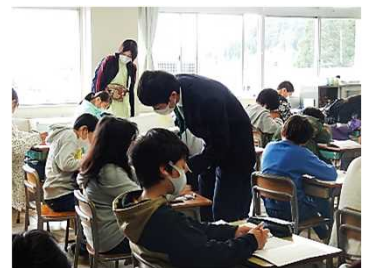
学習参観での様子 5年生

16日（土）は、令和4年度第1回目の学習参観・学級懇談会を行うことができました。授業開始日から5日目という状況での開催でしたが、1年生から6年生まで全校児童が一生懸命に取り組む様子を御覧いただけたのではないのでしょうか。学級懇談にもご協力いただき、40分間という短時間での設定ではありましたが、担任と保護者の皆様が直接会話させていただきました。対面での会話が難しい状況下で、保護者の皆様に御協力いただきましたことに心より感謝申し上げます。今後、心配やご不明な点は、連絡帳やお電話でお知らせくださいますようお願いいたします。