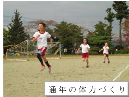
通年の体力づくり