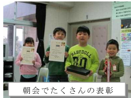
朝会でたくさんの表彰