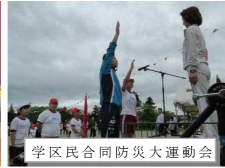
学区民合同防災大運動会