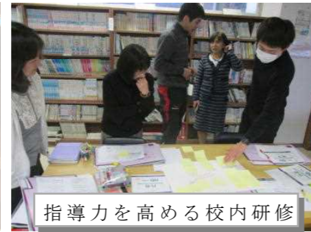
指導力を高める校内研修