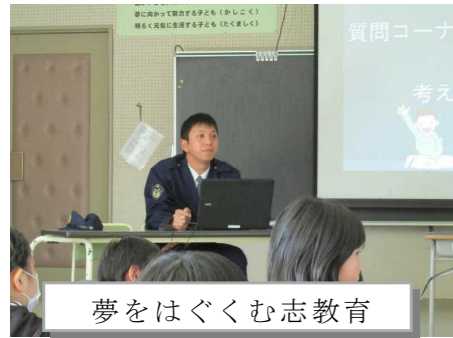
夢をはぐくむ志教育