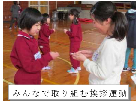
みんなで取り組む挨拶運動