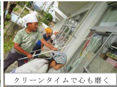
クリーンタイムで心も磨く