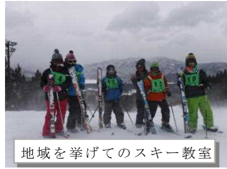
地域を挙げてのスキー教室