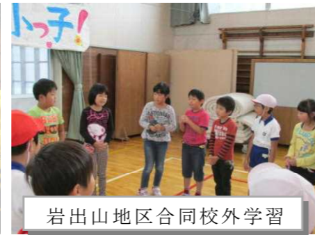
岩出山地区合同校外学習