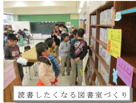
読書したくなる図書室づくり