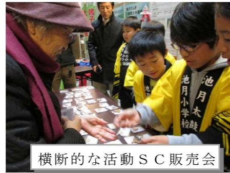
横断的な活動 S.C 販売会