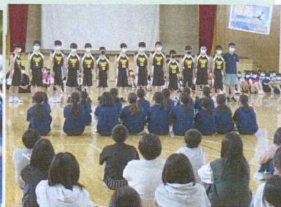
中総体壮行式への参加