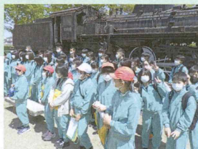
西中・西古川小合同の公民館(SL機関車)学習

体を動かし、頭をフル回転。聴く力、話す力を使い、関わりながら共に伸びていく。そんな経験をたくさん積ませたい。古川西中学校に4小学校児童が集まり活動しています。