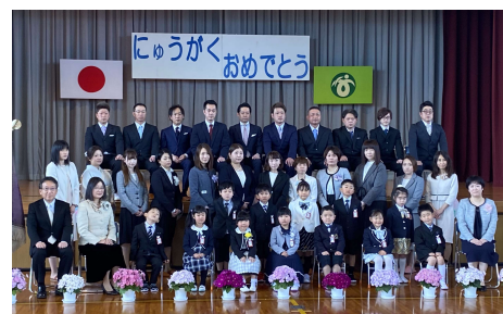
東大崎小として最後の入学式です

今後も子どもたち一人一人が明るく元気に、楽しい学校生活を送れるよう担任を中心に職員全体で見守っていきたく思います。