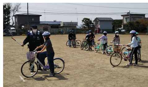
一人一人に声がけしていただきました

古川西駐在所の所長さんをはじめ3名の警察官と5名の交通指導隊の皆様を講師にお招きし、交通安全教室を実施しました。低学年は道路の正しい歩き方や横断の仕方を、中・高学年は自転車の正しい乗り方を学びました。「必ず体に合った自転車に乗ること」「自転車に乗る前や発進させるときは必ず左後方を確認すること」などを丁寧に教えていただきました。