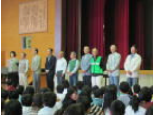
【地域の見守りたいの方々】

6月5日(水)3校時目、防犯教室を行いました。防犯教室に先立って、日頃学区内で子供たちを見守っていただいている「四小見守りたい」の方々を児童に紹介しました。見守りたい発足当時から10年続けていただいている方もいらっしゃる、学区内の防犯に大変協力いただいています。