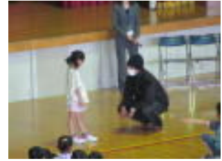
【防犯教室の一コマ】

防犯教室は、昨年度に引き続き警備会社のご協力をいただき実施しました。不審者からの身の守り方など、スライドや実際の不審者が出る場面を設定し、子供たち参加型の教室でした。「自分で自分の身を守る」ためにも、普段から訓練する必要があります。ご家庭でも不審者対応について、話し合いをお願いします。