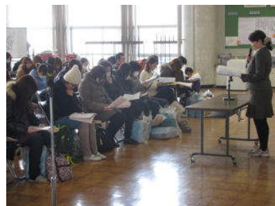
【保護者説明会の様子】

並行して行われた保護者説明会では、入学準備や通学路、保健・給食関係等についての話をしました。その中で、入学前に身に付けてほしいこととして①返事や挨拶ができるように②