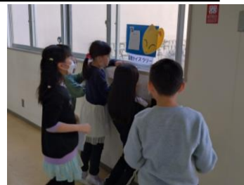
↑ 図書クイズラリーに挑戦している子供たちです。

本校でも、多くの児童に読書に親しんでもらうことを目的に、図書委員会を中心に「読書まつり」を開催しています。内容は、児童一人一人が書いた「ぼくわたしおすすめの本」の掲示、多読賞の児童にしよりのプレゼント、図書クイズラリー、3冊まで本を借りることができるなど盛りだくさんです。多くの児童が読書の楽しさを味わうことができるように声掛けをしていきます。