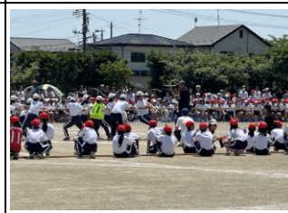
【力を合わせて綱を引きました:6年】