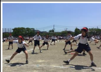
【ニシン漁を力強く表現しました:5年】