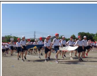
【青空の下、元気に入場しました】