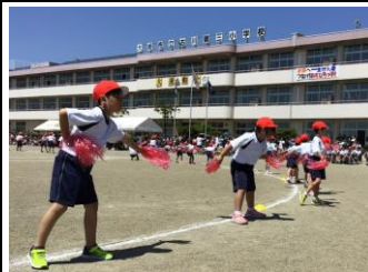
【初めての運動会、元気いっぱいに踊りました:1年】