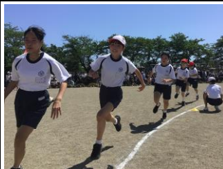
【全力で走り抜けた短距離走】