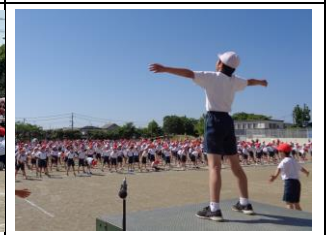
【全校児童での準備体操】