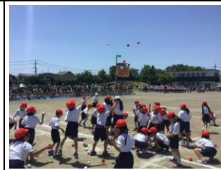
【みんなで大くさん玉を入れました:2年】