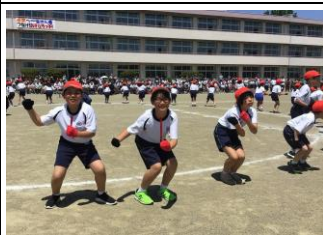
【みんなで楽しく踊りました:4年】