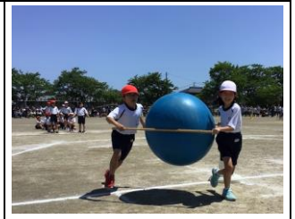
【力を合わせて上手に大玉を運びました:3年】