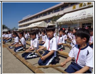
【太鼓の演奏と表現で盛り上げます】