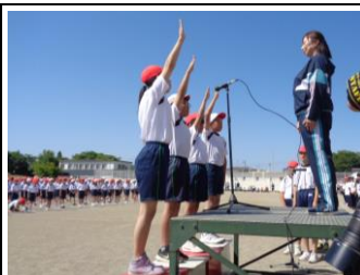
【堂々とした誓いの言葉】