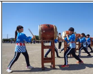
【古三小の伝統 三小太鼓】