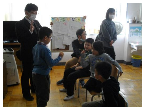
わかくさ2「1番がいい」