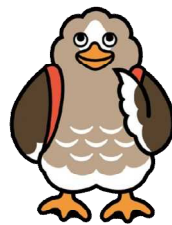
大崎市公式キャラクター パタ崎さん