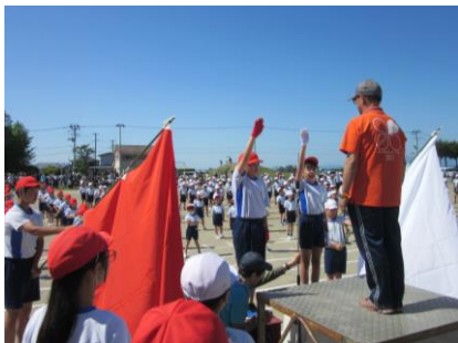
誓いのことば！ 赤組代表 白組代表