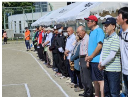
たくさんの来賓の方々に来ていただきました