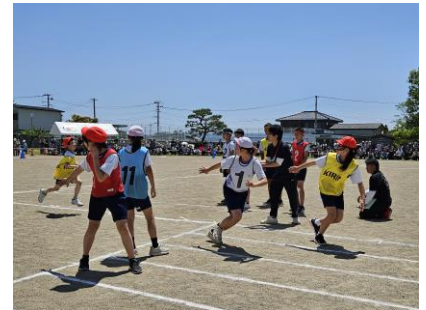
全力で走り抜く「よつばっこ代表リレー」