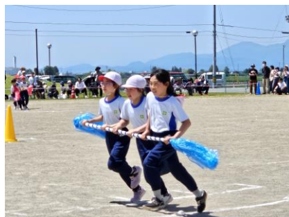
息を合わせて「北小タイフーン」〔3・4年生〕