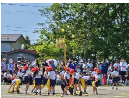
軽快に「ダンシング玉入れ」〔1・2年生〕