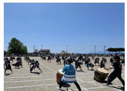
大迫力の「北小ソーラン」〔5・6年生〕