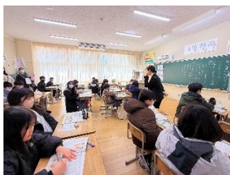
〈5年・道徳「バトンをつなげ」〉