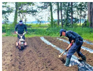
【大豊作！北小農園づくり】