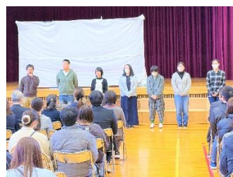
〈PTA 総会「今年度の活動に感謝」〉