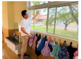
【子供では届かない高い所の掃除】