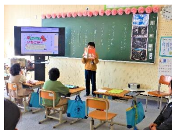
〈けやき・国語「今まで学習したこと」〉