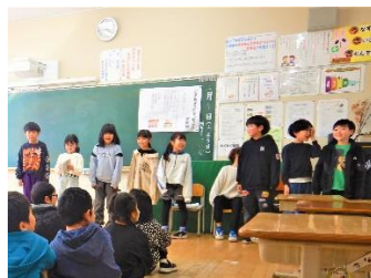
〈2年・生活「できるようになったこと」〉