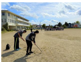
【運動会に向けて校庭除草作業】