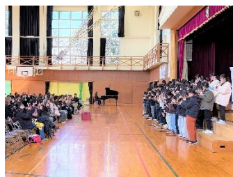
〈6年・総合「感謝の会」卒業に向けて〉