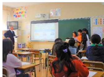
〈3年・国語「道具の移り変わりを説明」〉