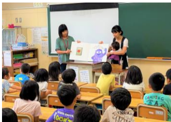
【月2回の低学年読み聞かせ】

学校としては、「人とかかわりが広がる開かれた学校づくり」を目指して進めてきた一年でしたが、スクールサポーターの皆様のお力が、家庭や地域とつながって、子供たちを見守り、支えていく環境が醸成されてきています。その多くの支えのおかげで、まっすぐに明るいよつばこが育っています。本当にありがとうございました。