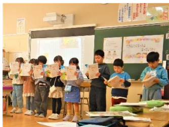
〈1年・生活「できるようになったこと」〉

旧役員の皆様、今年度の御尽力、大変ありがとうございました。新役員の皆様、次年度よろしくお願いたします。