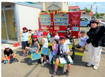
【校外学習引率補助】