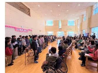
〈4年・学活「10才を祝う会」感謝と抱負〉