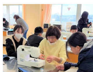
【習字・水泳・マシンなどの学習支援】