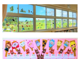
【図書室を明るくする季節飾り】