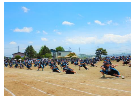
大迫力の「北小ソーラン」[5・6年生]