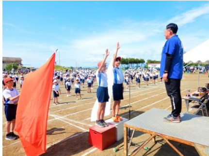
誓いのことば！ 赤組代表 白組代表