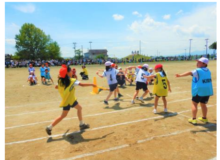
全力で走り抜く「よつばっこ代表リレー」