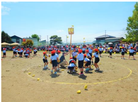
笑顔いっぱい「ダンシング玉入れ」[1・2年生]