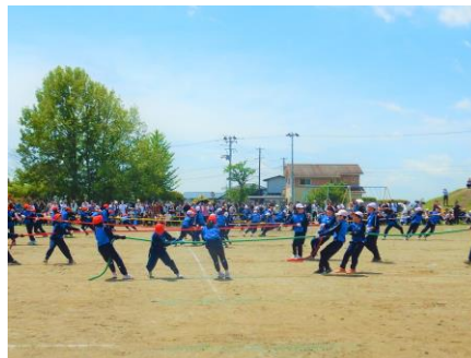
作戦&パワー！「綱取り合戦」[3・4年生]