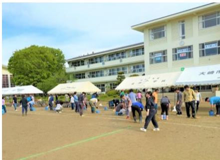
御協力に感謝！PTAによる早朝の校庭整備

運動会実施にあたり、PTA本部役員、各地区委員をはじめ、保護者の皆様には、会場の準備や本部席での対応、終了後の片付け等でたくさんの御協力をいただき、本当に助かりました。また、駐車場や観覧席等では限られたスペースの中、御不便をお掛けした部分もあったかと思いますが、皆様の「ゆずり愛い（合い）」の心で温かな雰囲気を作ってくださったことにも、心から感謝申し上げます。ありがとうございました。